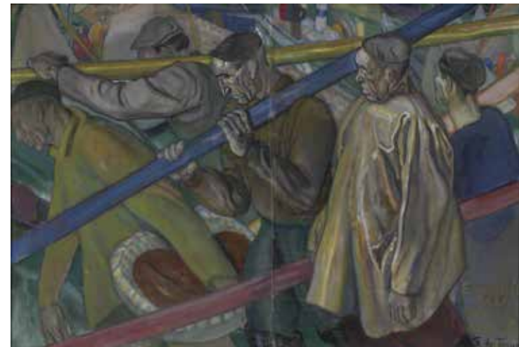
Carlos Sáenz de Tejada (Tánger, Marruecos, 1897 - Madrid, 1958) Remeros de Ondarroa , hacia 1917 Museo de Bellas Artes de Álava

Nos enfrentamos a una tarea nada fácil al confrontar las colecciones de arte vasco entre 1880 y 1930, aproximadamente, de dos museos totalmente diferentes en cuanto a sus dimensiones, objetivos, trayectorias y funciones. La razón de la muestra que aquí se presenta es la existencia de unas colecciones de obras de arte que se han venido denominando “arte vasco”, entendido como el arte que se realizó en el País Vasco durante los últimos años del siglo XIX y primeros años del siglo XX, con unos intereses y actitudes parecidos que llevan a agruparlo dentro de esa etiqueta muchas veces incómoda, pero práctica, para describir un arte que aparentemente puede tener cierta unidad, pero que puede también tener enormes diferencias entre los distintos autores que se engloban en torno al término.