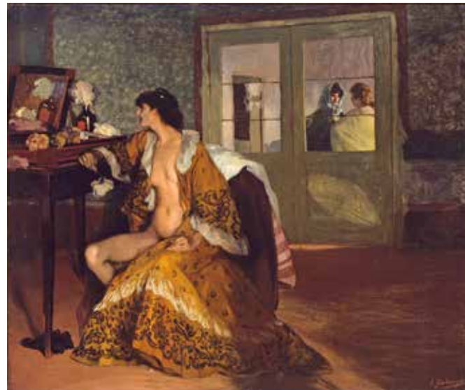
Ignazio Zuloaga (Eibar, Gipuzkoa, 1870 - Madril, 1945) Zelestina edo Matilderen begi niniak , 1906 Reina Sofia Arte Zentroa Museo Nazionala

Bilbea eta hari askeak: euskal arteko bi bilduma elkarrekin solasean