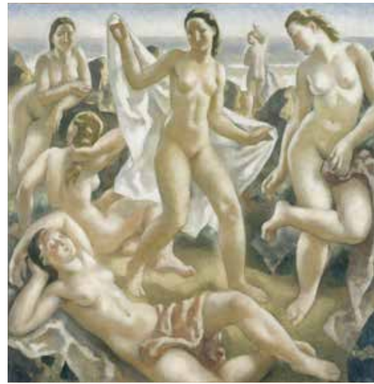
Aurelio Arteta (Bilbo, 1879 - Mexiko, 1940) Bainulariak , 1930 Reina Sofia Arte Zentroa Museo Nazionala