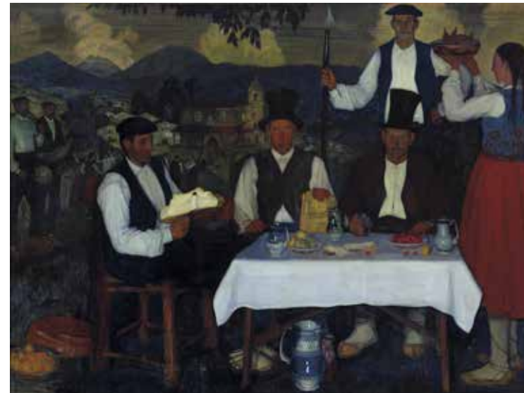
Ramon Zubiaurre (Garai, Bizkaia, 1882 - Madril, 1969) Auzoko agintariak , 1909 - 1910 aldera Arabako Arte Ederren Museoa

Juan de la Encinaren liburuaren izenburua une hartako jarduera artistikoaz teorizatze nahiari lotuta dago, eta egileak ere interpretatu nahi izan zuen ordura arte praktika sakabanatua zena, nahiz eta ezaugarri komunak eduki. Interpretatzeko edo teorizatze asmo orok alde batera uzten ditu ezarritako