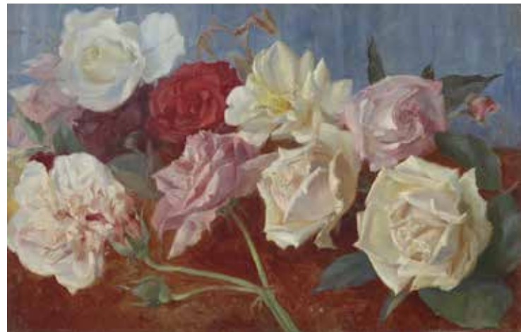
Fernando AMARIKA (Gasteiz, 1866 – 1956) Arrosak , 1895

Paradisuko fruituak, loreen eta lorategien margolaritza Arabako Arte Ederren Museoan erakusketaren bidez, loreen eta lorategien irudikapenera hurbildu ahal izango gara, museo honetako funtsetan dauden obra asko erabiliz horretarako. Hura aitzakia hartuta, mundu sentikor horretara iristeko ahalegina egin nahi izan dugu; hain zuzen ere, naturarekin eta gizakiarekin zuzenean lotuta dagoen mundu sentikor horretara, bai loreek bai lorategiek miremena sorrarazi digute eta, gure zentzumenendako edergarri izan baitira.