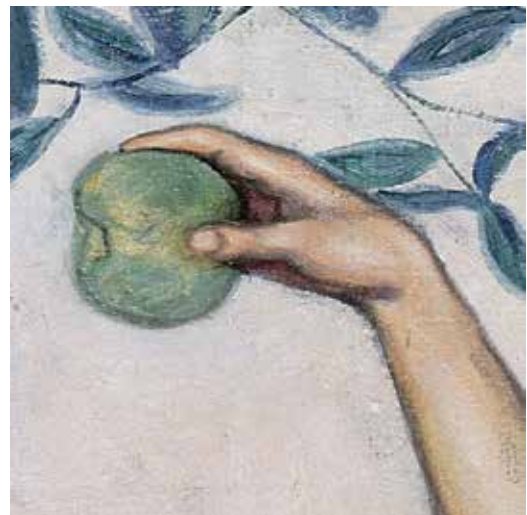
Ángel OLARTE (Vitoria-Gasteiz, 1897 – 1924) Adán y Eva , 1923 (detalle)

La exposición Frutos del paraíso, pintura de flores y jardines en el Museo de Bellas Artes de Álava nos permite acercarnos a la representación de las flores y los jardines a través de un gran número de obras pertenecientes a los fondos de este museo. Con ella hemos querido aproximarnos a ese mundo sensible en íntima relación con la naturaleza y con el ser humano, pues tanto las flores como los jardines nos han provocado admiración, constituyendo un ornato para los sentidos.