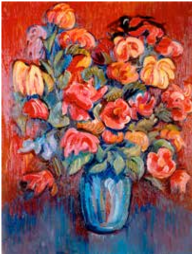
Nicolás A. TARKHOFF (Moscú, 1871 – Orsay, Francia, 1930) Bouquet de fleurs printanières ( Ramo de flores primaverales )

La pintura de flores y floreros ha buscado la plasmación tangible de la naturaleza en un intento de capturar eternamente esa viveza que tiene fin, que es efímera, que se marchita. Pero también aporta una función decorativa, pues la flor siempre ha merecido nuestra admiración por su belleza y deleite en un intento de tener a nuestro alcance su primor natural. No hemos de olvidar su valor simbólico, pues sus mensajes alegóricos nos han acompañado siempre, aunque en ocasiones hayamos perdido parte de su contenido en favor del