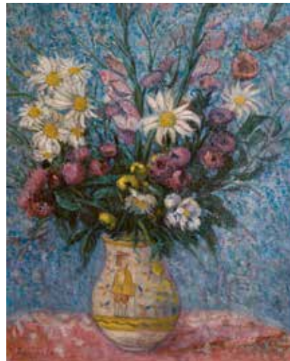
Juan de ECHEVARRÍA (Bilbao, 1875 – Madrid, 1931) Florero con margaritas , 1915

propio deleite y disfrute formal. Tampoco hemos abandonado su ancestral uso ritual, ceremonial, sus propiedades medicinales y culinarias e incluso su inspiración literaria en poemas y cantos.