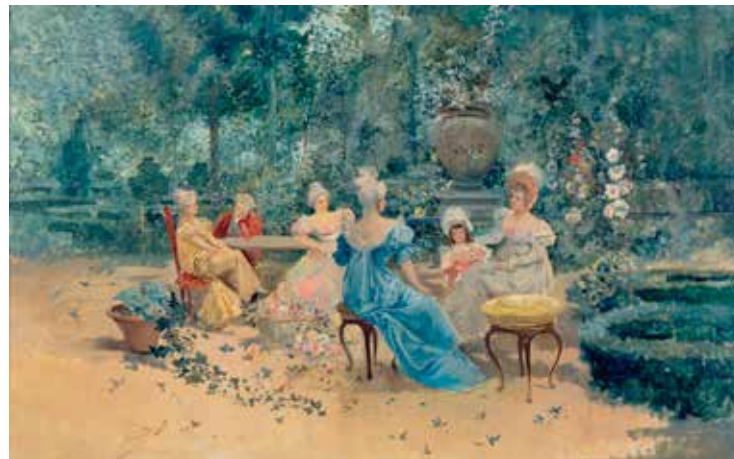
Eugenio LUCAS VILLAAMIL (Madril, 1858 – 1918) Familia eszena lorategian

Loreen eta loreontzien margolaritzak naturaren irudikatze nabarmena bilatu du, amaiera duen eta iheskorra den bizitasun hori, esaterako, berehala zimeltzen den lore-sorta batena, betiko atzeman nahian. Baina eginkizun apaingarria ere badauka; izan ere, loreen margolanak gure mirespena izan du beti bere edertasunagatik eta bikaintasun naturalaren zati bat gure eskura edukitzen saiatzearen atseginagatik. Ezin ahaztu dezakegu daukan balio sinbolikoa, haren alegoria mezuak gure lagun izan baitira betidanik, nahiz eta batzuetan hark gordetzen duena galdu dugun gure atsegina bilatzearen eta haren