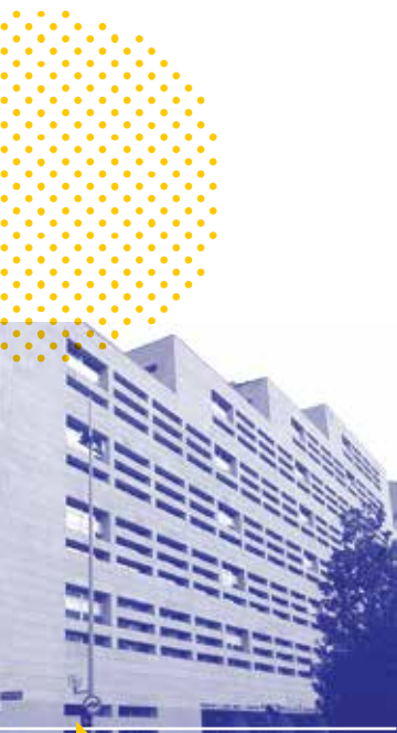
Servicio de Asuntos Europeos. Diputación Foral de Álava.

La Unión Europea es una asociación económica y política que cuenta con varios instrumentos financieros que apoyan el desarrollo económico de las regiones. Los grandes fondos como el Fondo Europeo de Desarrollo Regional (FEDER), el Fondo Social Europeo (FSE), el Fondo de Cohesión o el Fondo Europeo Agrícola de Desarrollo Rural (FEADER) así como los Programas e Iniciativas comunitarias contribuyen al crecimiento y cohesión europea.