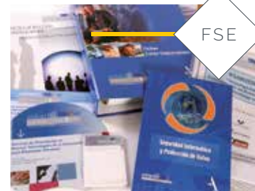
Proyecto transnacional Adapt@