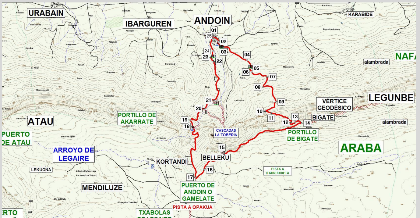
Mapa de la ruta.