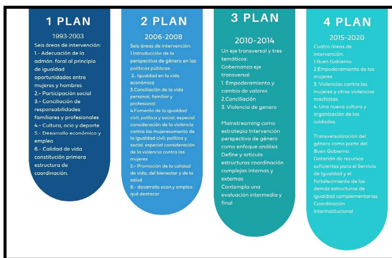
Imagen 1. Evolución de los planes forales para la igualdad.

Volviendo al momento actual, y considerando el legado de los anteriores planes para la igualdad, la DFA se centra en el diseño y elaboración del V Plan Foral para la Igualdad de Mujeres y Hombres de Álava (2022-2026) . El anclaje estratégico de este V Plan radica en la necesidad de continuar con la estrategia de saltar al territorio abordada en el anterior, pero intentando profundizar y mejorar sus ejes y estructuras de actuación, adaptándolas a las nuevas necesidades descubiertas tras la crisis sociosanitaria actual. Además, atiende de manera también estratégica a los cambios normativos derivados de la aprobación de la modificación de la Ley para la Igualdad de Mujeres y Hombres.