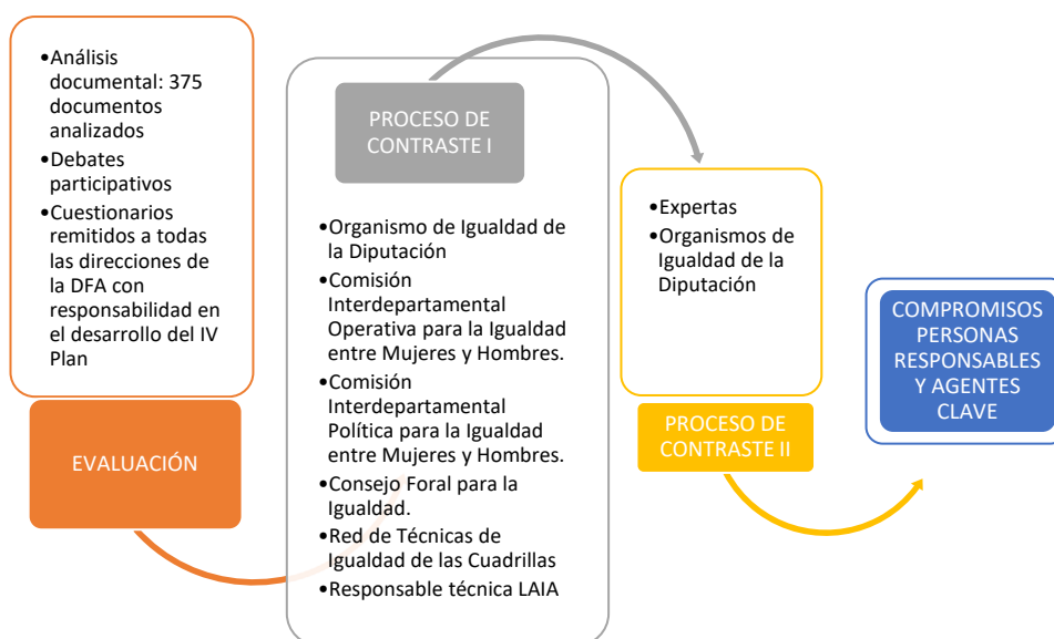
Tabla 1 Resumen de fases de la construcción colectiva del V Plan Foral para la Igualdad de Mujeres y Hombres de Álava.

Partiendo de la evaluación, se ha llevado a cabo la elaboración participativa del V Plan. Este proceso de nueve meses de duración se ha desarrollado en base a los elementos descritos en las siguientes páginas.