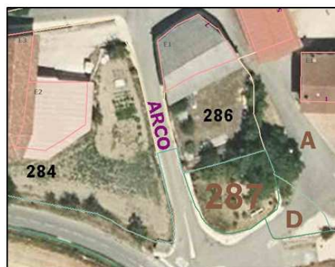
Ámbito de la Modificación Puntual en Zuazo de San Millán sobre ortofoto destacándose las parcelas catastrales.