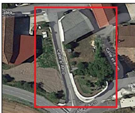
Ámbito de la Modificación Puntual en Zuazo de San Millán sobre ortofoto.

Tal y como se ha señalado anteriormente, la Modificación Puntual afectaría a las alineaciones de las parcelas 284, 286 y 287 del polígono 1 de la calle Del Arco de Zuazo de San Millán, en el término municipal de San Millán del Territorio Histórico de Álava.