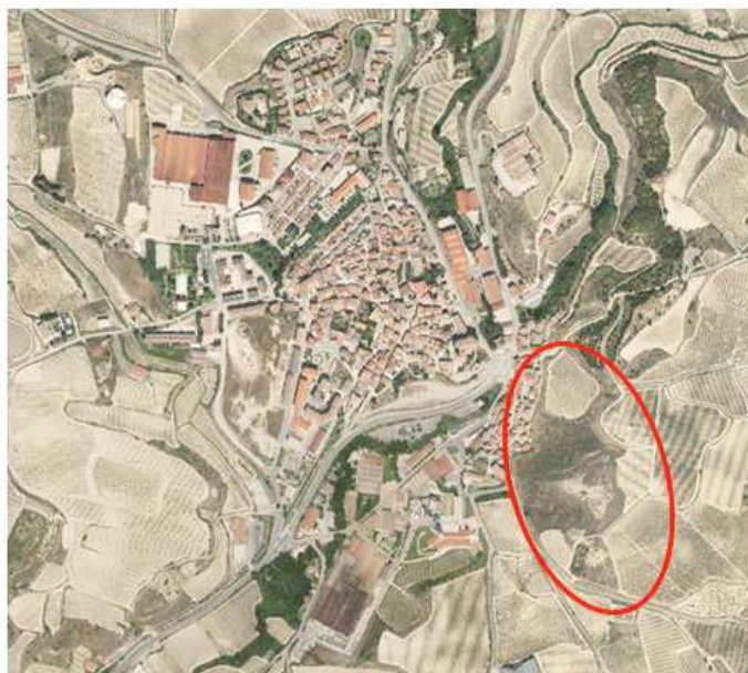
Gorritz adierazi da San Roke SR-2 sektoreko plan partzialaren eremua

Eltziegoko San Roke SR-2 bizitegi sektoreak, HAPOko Hirigintza Araudiaren 1.3.2.5. artikularekin (3. apartatua) bat etorritik egindako doiketaren ondoren, 36.783,67 m 2 -ko azalera dauka eta barnean hartzen ditu 3 poligonoko lurzati hauek: 1, 2, 140 A, 237 eta 297 A lurzatiak, osorik; eta 135, 137, 138, 143, 144, 145 B eta 148 lurzarien zati bat.