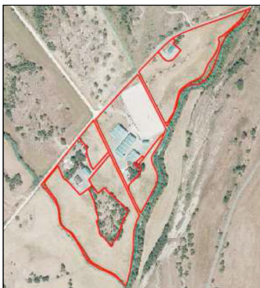
Ámbito del Plan Especial sobre ortofoto aérea actual