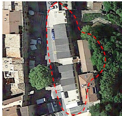
Aldaketa puntualaren eremuaren katasstro planoa, gainean ortoargazkia duela