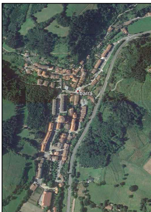
BIPBren eremuaren irudia

BIPBren jardun eremua Ibarra herrigune historikoari dagokio (Aramaio udalerrian); lurzoru urbanizatu finkatua da, eta eraikin historikoak, eraikin modernoagoak dituzten eremuak, autokontsumorako baratzeak, plaza eta hiri parkeak biltzen dira bertan.